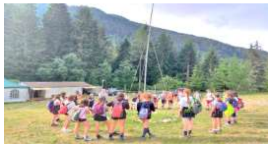
Campeggio a S. Antonio di Mavignola