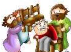
Una scala per salvare e servire

più fragili e fin dove l'umanità è fragile e debole, proprio lì incontriamo Dio. I discepoli forse pensano che la sofferenza e la fatica siano solamente un passaggio magari evitabile per incontrare Dio e realizzare se stessi. Gesù invece dice che proprio in quel cammino di abbassamento nel servizio e nel dono ci sono l'incontro con il Signore e la gloria della propria vita.