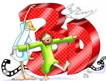
La Trinità: un Dio in 3D

la possiede anche il Figlio e lo Spirito potrà guidare i discepoli a essa. Gesù ricorda il Padre e annuncia lo Spirito senza proporsi come unico riferimento anche se erano i “suoi” discepoli.